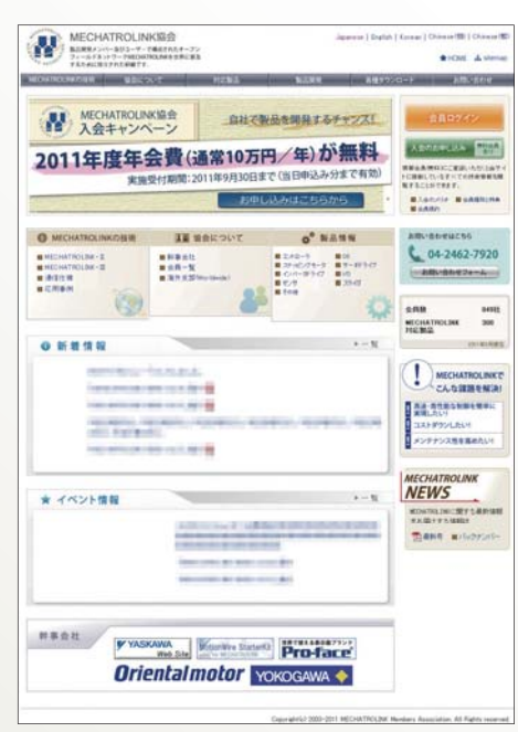
새 단장한 웹 사이트 이미지