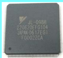
JL-098B LQFP 20 □