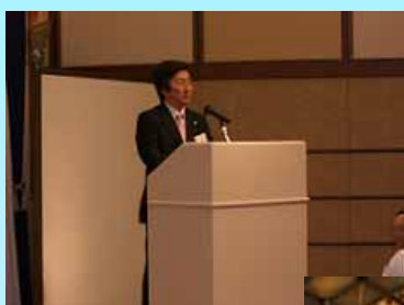
全会·讲演会·联欢会的场景

在日程的最后是联欢会上会员们进行了亲切的交谈，交换了信息，大家在今后活跃开展营业活动充满信心的同时，也对MECHATROLINK的普及寄予了深切的期待。