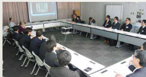
의견 교류회의 모습

이후 의견 교류회에서도 활발한 질의응답을 통해 다양한 의견이 발표되어 고객, 마켓부회 양쪽에 유익한 기회가 되었습니다.