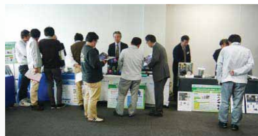
성황을 보인 제품 전시