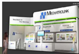
SEMICON China2012 MMA 부스 이미지