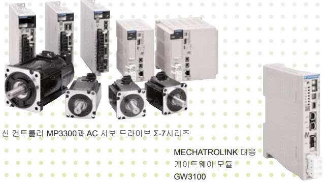
머신 컨트롤러 MP3300과 AC 서보 드라이브 Σ-7시리즈

그리고 MMA의 간사회사로서 MMA 회원과 MECHATROLINK 사용자 여러분께 이바지할 수 있도록 MECHATROLINK의 새로운 보급을 위해 최선을 다하겠습니다.