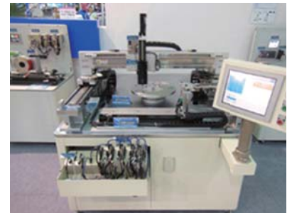
Art Control Systems, Inc에 의한 데모