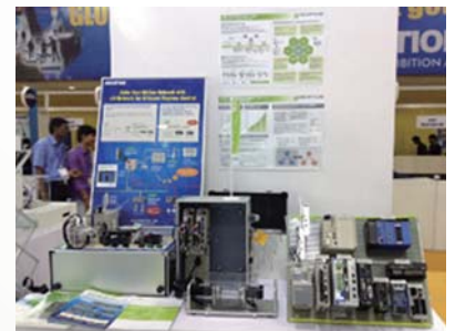
MECHATROLINK 대응 제품 전시