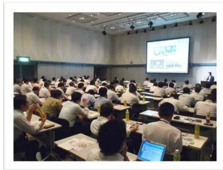
2011年度総会風景(実績:54社、118名出席)